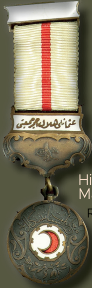
Hilal-i Ahmer Madalyası Red Crescent Medal