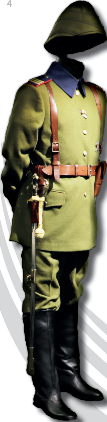
Jandarma Mülazım-ı Sâni Gendarmerie Lieutenant

1915 Çanakkale Muharebeleri Osmanlı Üniformaları Sergisinde 10 adet farklı sınıf ve rütbelerde zabıt (subay) üniforma replikaları yer almaktadır. Sırasıyla; Ferik (Liva Komutanı), Erkan-ı Harp Miralay (Alay Komutanı), Piyade Binbaşı (Tabur Komutanı), Ağır (Kale) Topçu Yüzbaşı (Batarya Komutanı), Süvari Üsteğmen, Tabip Mülazımievveli, Jandarma Mülazımisanisi, Sahra Topçu (Seyyar Topçu) Çavuşu, Alay İmamı (Din İşleri Memuru) ve Bahriye Güverte (Harp) Sınıfı Yüzbaşı üniformaları tüm teferruat, teçhizat, madAalya ve nişanlarıyla sergilenmektedir. Çanakkale Muharebeleri'nin birinci döneminde, subay üniformalarının sınıf rengi olan yakalarının, sırma apoletlerin ve parlayan kılıç aksamının düşman tarafından uzaktan fark edilerek nişancılar tarafından hedef alınması, bu konuda bir değişiklik yapılmasını gerekli kılmıştır. Bu çerçevede 3 Haziran 1915 tarihinden itibaren sınıf rengi yakalar hâki ceket kumaşından imal edilmeye, sınıf rengi ince bir zih yaka kenarlarına, uzaktan fark edilmeyecek biçimde, Süvari Mülâzımievveli üniforması örneğinde olduğu gibi, dikilmeye başlanmıştır. Ayrıca apoletler hâki yünden imal edilmiş, apolet üzerine takılan yıldızlarla ceket düğmeleri mat metalden imal edilmeye başlanmıştır.