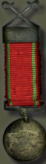
Gümüş Liyakat Madalyası Silver Medal of Merit