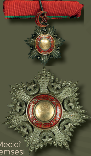
2. Derece Mecidi Nişanı ve Şemsesi