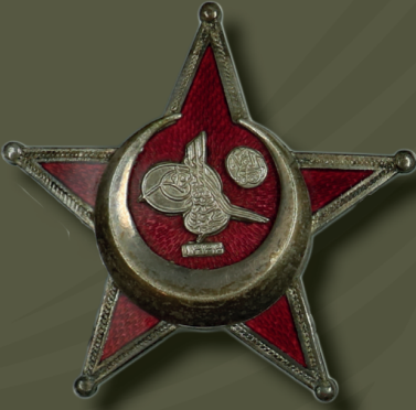
Osmanlı Harp Madalyası Ottoman War Medal

The red cord sewn on the edges of the trousers was removed, and when a sword was required to be worn on the uniform, a khaki fabric cuff was put on the scabbard of this sword and the hilt was covered with khaki fabric. During the Gallipoli Battles, the officers generally wore the medals such as the Osmanieh, the Medjidie, the Gold and Silver Medal of Distinction, the Gold and Silver Medal of Merit and the War Medal. On the battlefield, while the greatest badges and the greatest medals were worn, all the earned badges and medals were worn during the ceremonies.