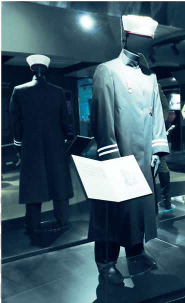
Alay İmamı Regiment Imam

In the 1915 Gallipoli Battles Ottoman Uniforms Exhibition, 10 replicas of officer uniforms of different units and ranks are displayed. Respectively; Ferik (Brigade Commander), Staff Colonel (Regiment Commander), Infantry Major (Battalion Commander), Heavy (Fortress) Artillery Captain (Battery Commander), Cavalry First Lieutenant, Medical First Lieutenant, Gendarmerie Third-Lieutenant, Field Artillery (Mobile Artillery) Sergeant, Regimental Imam (Chaplain) and Naval Deck (War) Unit Captain's uniforms are displayed with all their details, equipment, medals and badges. During first period of the Gallipoli Battles, the fact that the collars, gold epaulettes and shining sword accessories of the officer uniforms, which were the units' colour, were noticed by the enemy from a distance and aimed by the gunners, had made changes in this regard essential. Within this scope, dating from June 3, 1915, collars in unit colours began to be manufactured from khaki jacket fabric, and a unit coloured thin armour was sewn onto the collar edges in a way that would not be noticed from a distance, as shown in the example of Cavalry First Lieutenant uniform. Furthermore, epaulettes were made of khaki wool, and jacket buttons had been started to be produced from matt metal with the stars attached to the epaulettes.